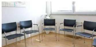
une salle d'attente